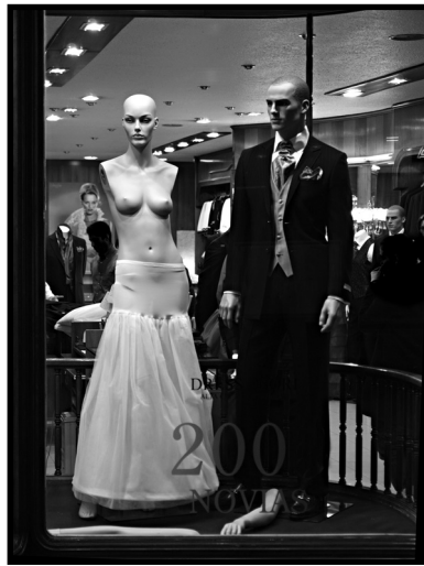
"El escaparate (alegoria)" Finalista 2016