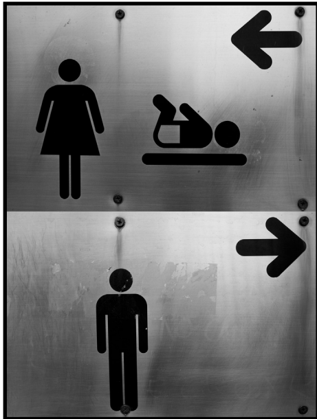
"Cambiamos o qué" 3er Premio - 2016

LIZARRAKO UDALEKO BERDINTASUN BATZORDEAREN XV. ARGAZKI LEHIAKETA